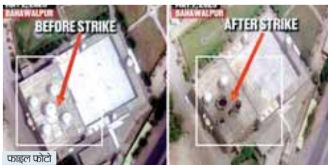
भारतीय उपग्रह 24 घंटे सक्रिय थे

नारायणन ने कहा कि ऑपरेशन सिंदूर के दौरान सभी उपग्रह चौबीसों घंटे सक्रिय थे और सभी आवश्यकताओं को पूरा कर रहे थे। 400 से अधिक वैज्ञानिक दिन-रात, पूरी क्षमता के साथ काम कर रहे थे और मिशन के दौरान सभी पृथ्वी अवलोकन और संचार उपग्रह पूरी तरह से सक्रिय थे।