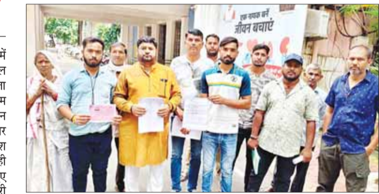
लेकर समस्त ग्रामीणों ने कई बार वरिष्ठ अधिकारियों को जांच के संबंध में साक्ष के