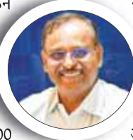
राष्ट्रीय प्रबंधन सम्मेलन

भारतीय अंतरिक्ष अनुसंधान संगठन (इसरो) के अध्यक्ष वी. नारायणन ने मंगलवार को ऑपरेशन सिंदूर पर बड़ा खुलासा किया। उन्होंने बताया कि ऑपरेशन सिंदूर के दौरान सहायता प्रदान करने के लिए 400 से अधिक वैज्ञानिकों ने चौबीसों घंटे काम किया। सैन्य अभियान के समय पृथ्वी अवलोकन और संचार उपग्रहों के माध्यम से मदद पहुंचाई जा रही थी। अखिल भारतीय प्रबंधन संघ (एआईएमए) के 52वें राष्ट्रीय प्रबंधन सम्मेलन को संबोधित करते हुए वी. नारायणन ने कहा कि इसरो ने राष्ट्रीय सुरक्षा आवश्यकताओं के लिए उपग्रह डेटा उपलब्ध कराया। बता दें, जम्मू और कश्मीर के पहलगांम में 22 अप्रैल को आतंकवादियों ने आम सैलानियों को निशाना बनाया था और 26 लोगों की हत्या कर दी थी। इसके बाद भारत ने जिवाबी कार्रवाई की और 7 मई को ऑपरेशन सिंदूर की शुरुआत की गई। इसके तहत भारतीय सेना ने पाकिस्तान के क्षेत्र में घुसकर आतंकवादी ठिकानों को तबाह कर दिया था।